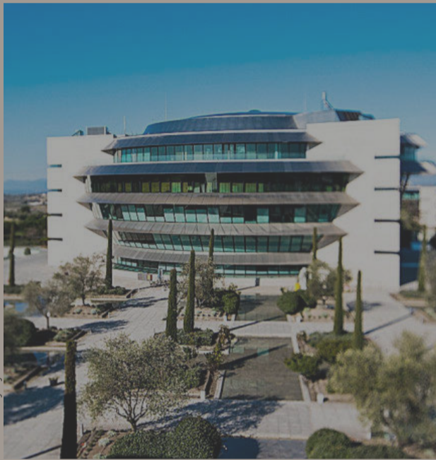
Sede de Santander.

PagoNxt Payments "proyecta alcanzar 2.000 millones de transacciones anuales a finales de este ejercicio", detalla la compañía, que aspira a ser un referente para los pagos A2A tanto en Europa como en América Latina.